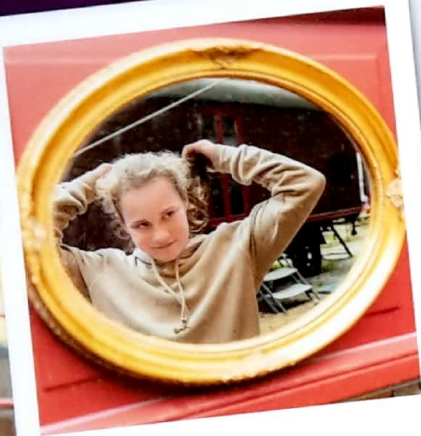
Kann losgehen! :-)