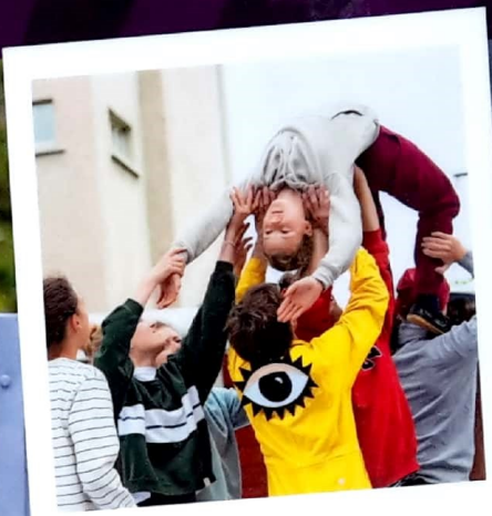
Akrobatik-Training im Freien

Samstag, 19. Januar Ich freu mich schon ... Bin sehr gespannt, wie die anderen so ticken. In den kommenden Monaten werden wir eine grosse Familie sein, von Mai bis Mitte September praktisch Tag und Nacht zusammen! Zwei kannte ich noch vom letzten Jahr, aber die anderen sind alle neu. Der Produktionsleiter erklärte uns das Thema der Tournee. Es heisst OPTIMUM. Dies, weil der Zirkus bald 30 Jahre alt ist und stetig angewachsen und professioneller geworden ist. Nach einem leckeren Mittagessen ging es auch schon ab in die Trainingshalle für die ersten Übungen. Nach diesem Tag freue ich mich sehr auf die kommende Zirkuszeit! Ab jetzt werde ich bis Ende März jedes zweite Wochenende im Zirkusquartier von Chnopf in Zürich verbringen.