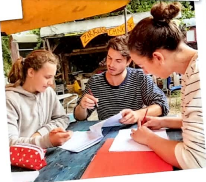
Yepp. So macht Schule Spass.