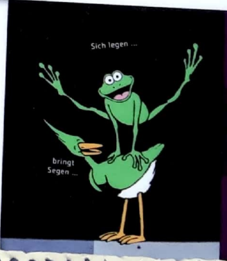
Sich legen ... bringt Segen ...

Sonntag, 10. Februar «Chinesischer Mast»!!! Das erste Probenwochenende geht zu Ende. Ich trainierte das erste Mal am «Chinesischen Mast». Meine Kollegin und ich versuchten, gleichmässig die vier Meter hohe Stange hinauf zu klettern - gar nicht so einfach! Ich bin echt froh, dass ich einige Jahre Erfahrung im Klettern habe.