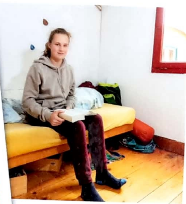
Mein Zuhause für die nächsten Monate