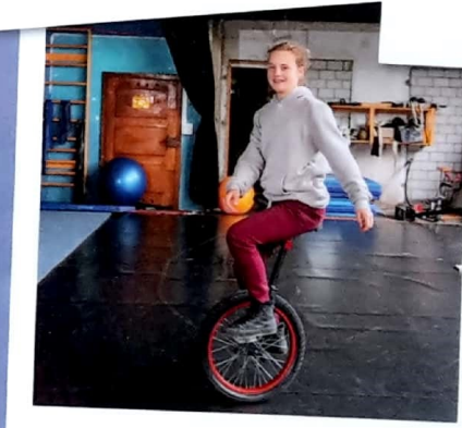
Einradtraining in der Halle