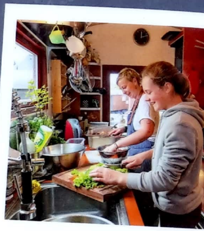
Küchendienst gehört auch dazu ...