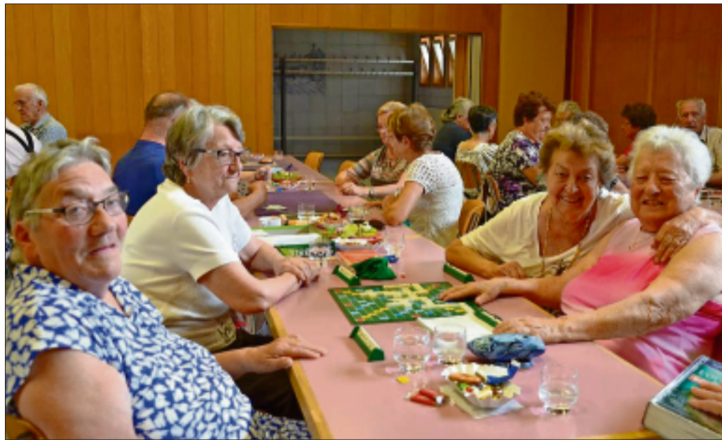
Les cartes ont la cote auprès des aînés, même si une table d'irréductibles préfère le Scrabble.

► Déjà en place à Saignelégier et Alle , des après-midi dédiés aux jeux et aux rencontres, destinés aux personnes retraitées, seront organisés dès le 6 août à Bure. ► Coordonnés par la section jurassienne de la Croix-Rouge suisse , ces «après-midi loisirs» ont lieu toutes les semaines. ► Si les cartes restent le jeu de prédilection des personnes présentes, certaines viennent y tricoter ou simplement y passer un moment de convivialité.