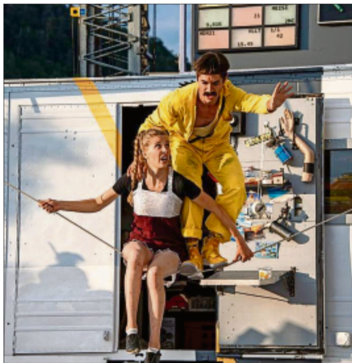
Gare au cirque Chnopf, qui se déploie depuis hier à Saint-Ursanne.

La caravane du cirque Chnopf s'est arrêtée hier à Saint-Ursanne. L'équipe d'acrobates, danseurs et musiciens se prépare à son premier spectacle, prévu demain à 16 h 30 au pied de la porte Saint-Jean, près du pont Saint-Jean Népomucène.