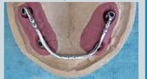
Unserer Meinung nach ist der individuell gefräste Steg (siehe Bild oben) in Verbindung mit einer Hybrid-Prothese der festeste und stabilste Zahnersatz.

Die Zahnmedizin hat wunderbare Fortschritte gemacht. Die Druckknöpfe haben sich bei grösseren Versorgungen nicht bewährt und werden nur noch vereinzelt angeboten. Unserer Meinung nach ist der individuell gefräste Steg in Verbindung mit einer Hybrid-Prothese der festeste und stabilste Zahnersatz. Die Anfertigung eines individuell gefrästen Steg benötigt in der Regel 2 bis 3 Wochen. Falls für den Steg Implantate gesetzt werden müssen, braucht es für eine Sofortversorgung im besten Fall einen Tag, normalerweise aber 2 bis 3 Wochen und falls es Knochenaufbau braucht, respektive bei schwierigen Knochenverhältnissen, kann es auch 6-12 Monate gehen.