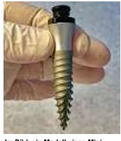
Im Bild: ein Modell eines Mini-Implantats (ca. 35-fache Vergrößerung - Das verwendete Implantat ist dann 2,4 mm im Durchmesser und hat eine Länge von 10 - 14 mm.)

Die Mini-Implantate eignen sich vor allem für die seitliche Oberkiefer- und Unterkieferfront (1, 2). Ebenso sind sie sehr gut dienlich für eine kostengünstige Verankerung von bereits bestehenden Totalprothesen im Unter- und Oberkiefer (3, 4, 5, 6, 7, 8, 9, 10, 11, 12, 13, 14, 15, 16, 17, 18, 19, 20, 21, 22, 23, 24, 25, 26, 27, 28, 29, 30, 31, 32, 33, 34, 35, 36, 37, 38, 39, 40, 41, 42, 43, 44, 45, 46, 47, 48, 49, 50, 51, 52, 53, 54, 55, 56, 57, 58, 59, 60, 61, 62, 63, 64, 65, 66, 67, 68, 69, 70, 71, 72, 73, 74, 75, 76, 77, 78, 79, 80, 81, 82, 83, 84, 85, 86, 87, 88, 89, 90, 91, 92, 93, 94, 95, 96, 97, 98, 99, 100).