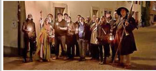
Mit Nachwächter und Magd begibt man sich auf eine Zeitreise ins Mittelalter