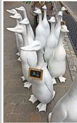
Die letzten Gänse suchen neue Heimat