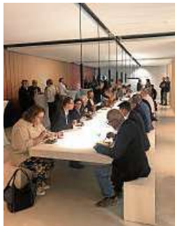
Die Mitglieder der KGA wurden traditionell mit einem Apéro riche verwöhnt